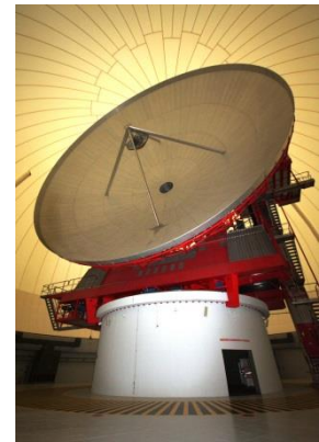
Radom von Innen